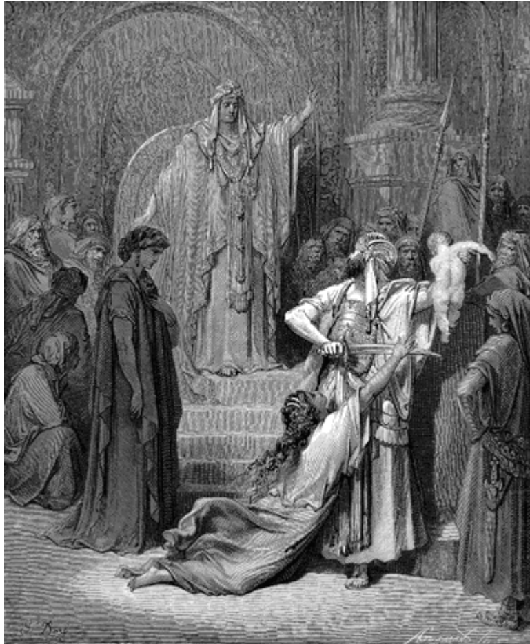
Gustave Doré, Sąd Salomona , [za:] www.creationism.org/images/DoreBibleIllus/dore_pl.htm